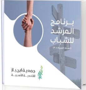
برنامج المرشد للشباب