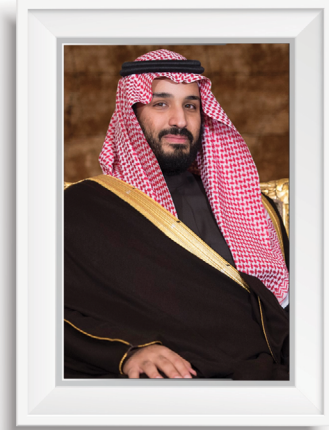
صاحب السمو الملكي الأمير محمد بن سلمان بن عبدالعزيز آل سعود ولي العهد نائب رئيس مجلس الوزراء

رؤية VISION 2030 المملكة العربية السعودية KINGDOM OF SAUDI ARABIA