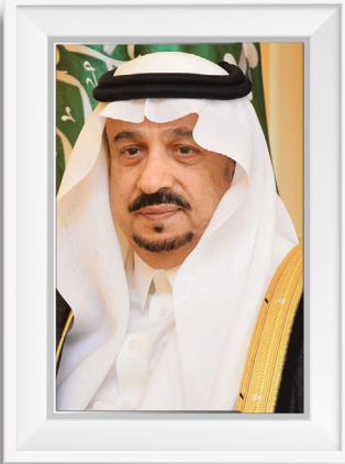
صاحب السمو الملكي الأمير فيصل بن بندر بن عبدالعزيز آل سعود أمير منطقة الرياض ورئيس مجلس الإدارة