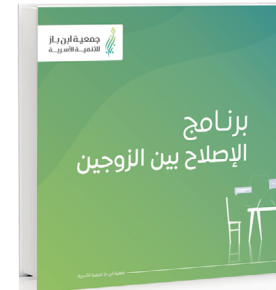
برنامج الإصلاح بين الزوجين