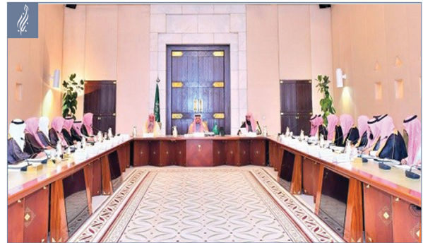
مجلس إدارة الجمعية