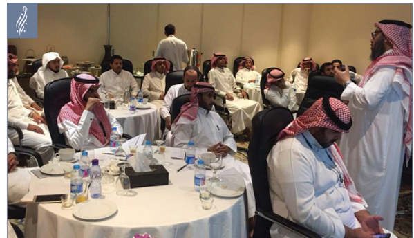
دورة المقبلين على الزواج