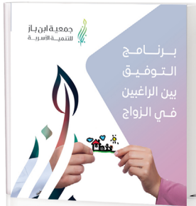
برنامج التوفيق بين الراغبين في الزواج