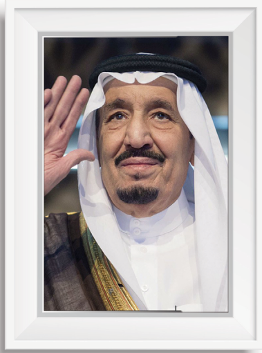
خادم الحرمين الشريفين الملك سلمان بن عبدالعزيز آل سعود

رؤية VISION 2030 المملكة العربية السعودية KINGDOM OF SAUDI ARABIA