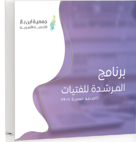
برنامج المرشدة للفتيات