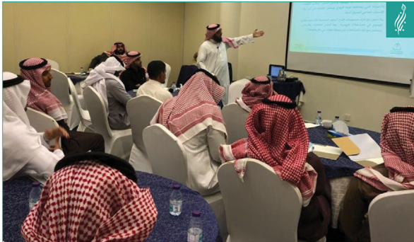
● دورة أسرية