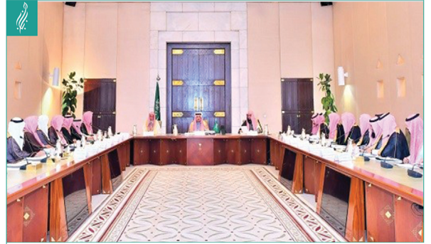
● مجلس إدارة الجمعية