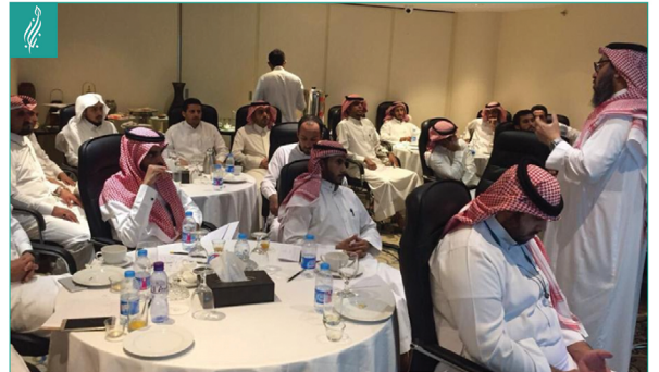
● دورة المقبلين على الزواج