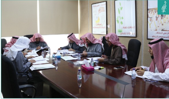
● اللجنة التنفيذية