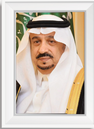
صاحب السمو الملكي الأمير فيصل بن بندر بن عبدالعزيز آل سعود أمير منطقة الرياض ورئيس مجلس الإدارة